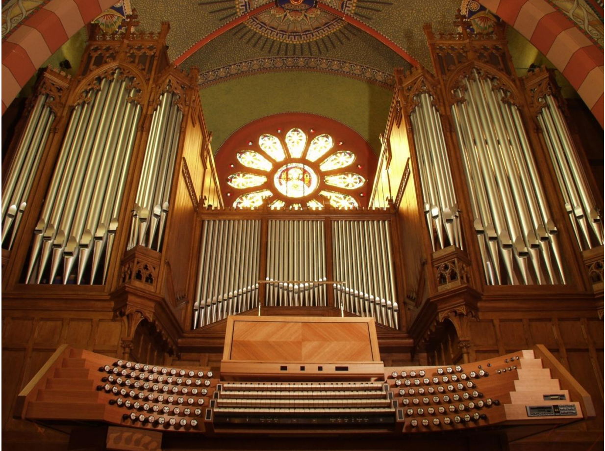
Stahlhuth-Jann Orgel (1912/2002; IV/78)

Disposition der Orgel und Fotos des Spieltischs siehe www.orgue-dudelage.lu